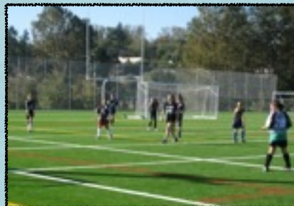
ÉQUIPES - GARÇONS, FILLES, MIXTE